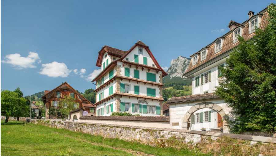
Palais von Hettlingen