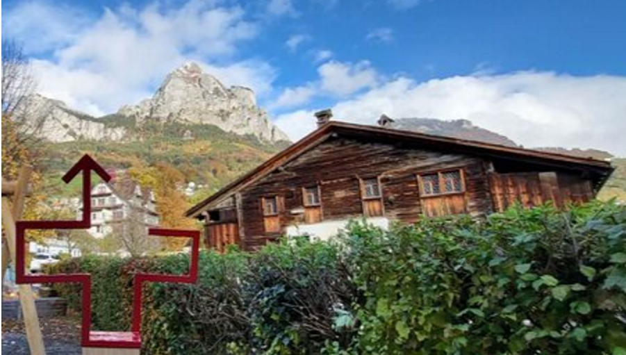
Fotospot Wiege der Schweiz Schwyz