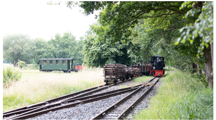
Dampfkleinbahn © Lena Descher-4.jpg - © Lena Descher