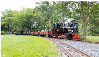
Dampfkleinbahn © Lena Descher-5.jpg - © Lena Descher