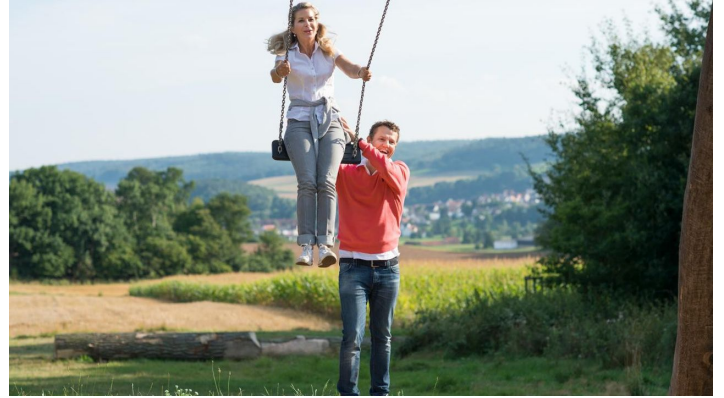
Himmelsschaukel bei der Warte Naumburg - © TAG Naturpark Habichtswald, Paavo Blofield