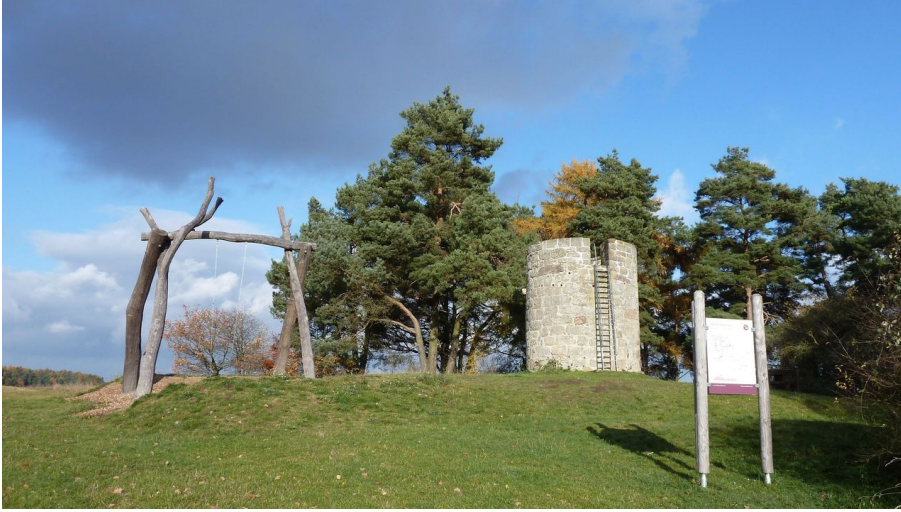
Warte Himmelsschaukel Naumburg