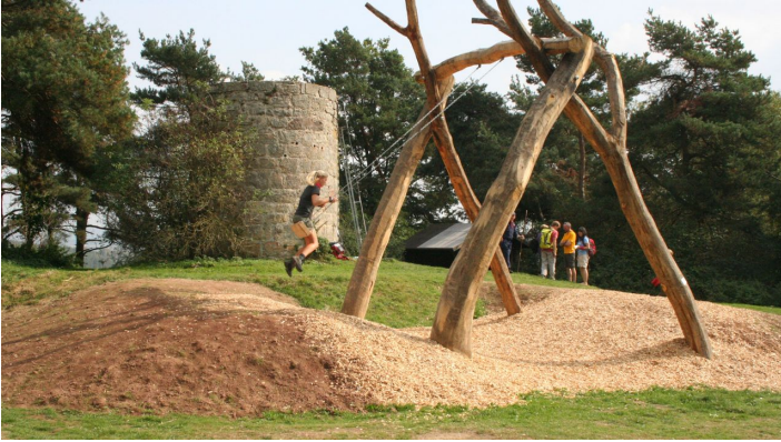
Himmelsschaukel Märchenrastplatz Warte Naumburg