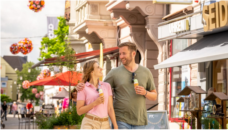
Hoexter-Stadtrundgang-Stadt Hoexter-D. Ketz-2023-086.jpg