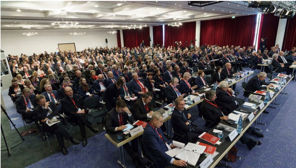
Rohstoffkonferenz 2018 in Potsdam