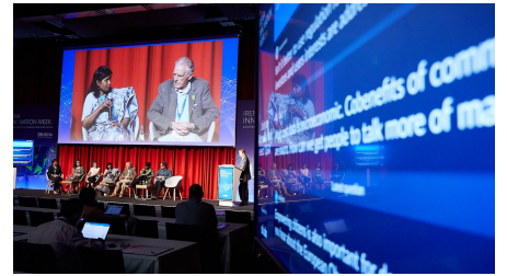
Inovation Week