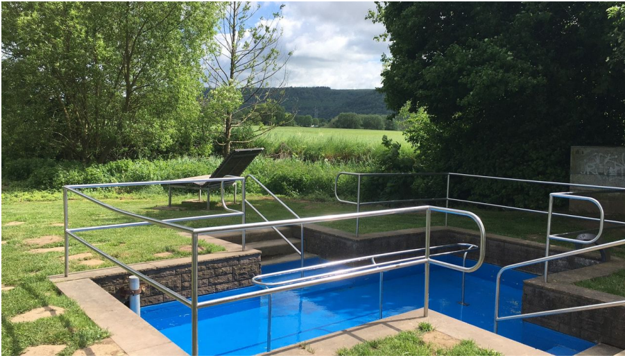
Kneipptrittbecken Beverungen - © Teutoburger Wald / Beverungen / Stadt Beverungen

Das Beverunger Kneipptrittbecken liegt direkt an der Bever und am beliebten Weser-Radweg R 99. Damit werden insbesondere Radfahrer zum Rasten und Wassertreten angesprochen.