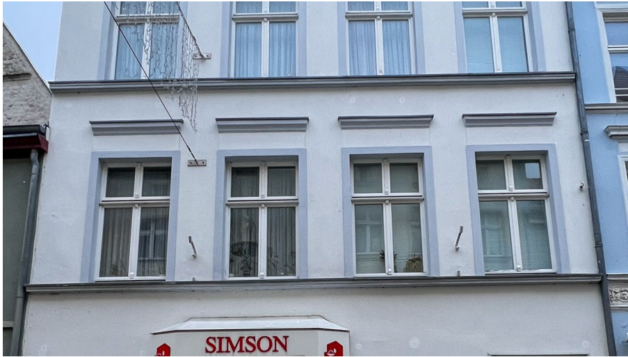
Simson Apotheke