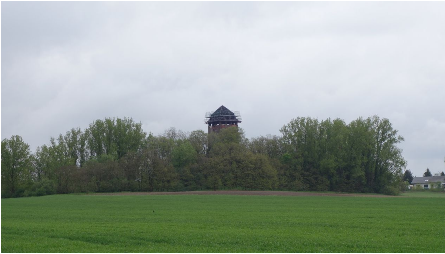
Pulverturm - © Thomas Kempfer, Elm-Freizeit, Allianz für die Region GmbH

Im Verlauf eines Grabens wurden nördlich von Haldensleben im 14. Jahrhundert mehrere Warten erbaut, von denen nur noch eine unter dem Namen Pulverturm erhalten ist.