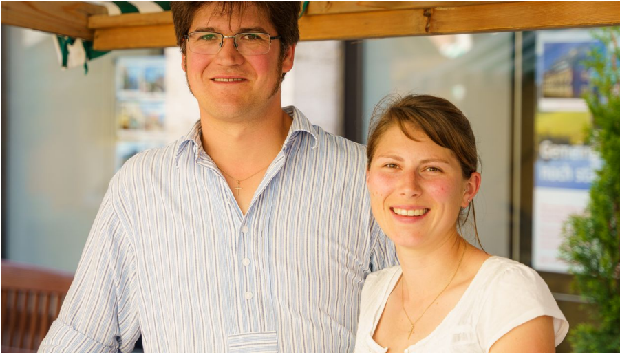
Familie Häringer Semerhansenhof @Tourist Information.jpg