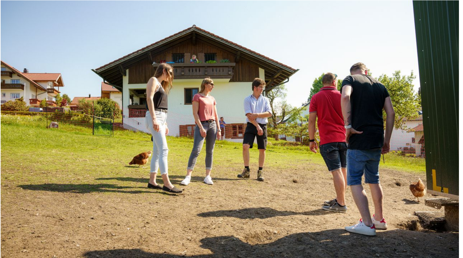
Hühnerstall Semerhansehof @Tourist Information.jpg