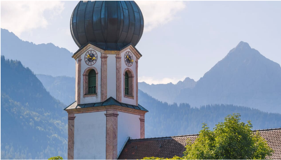
Kirche St. Sebastian in Krün Sommer