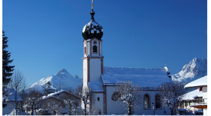
Kirche St. Sebastian in Krün Winter