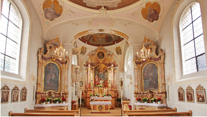
Kirche St. Sebastian in Krün von innen