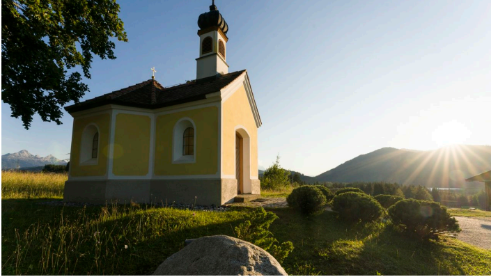
Kapelle Maria Rast an den Buckelwiesen bei Krün