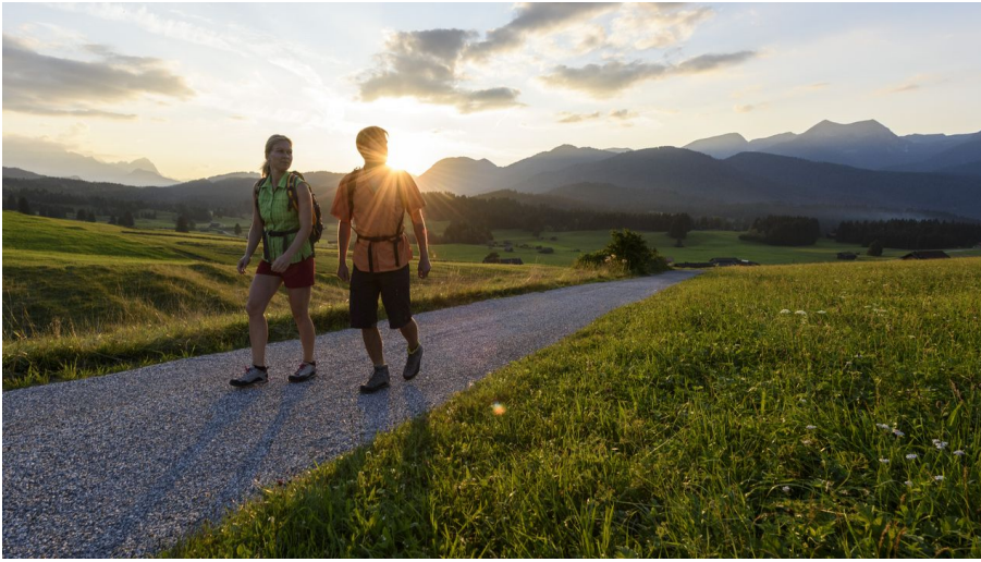
Buckelwiesen Abendstimmung