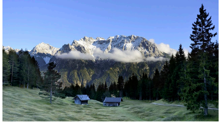
Wanderung durch die Buckelwiesen