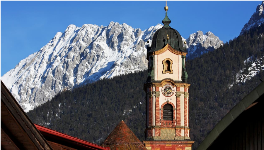
Kirche St. Peter&Paul zu Mittenwald mit Wörner

Die Pfarrkirche St. Peter und Paul ist eine alte Barockkirche im Herzen von Mittenwald und wurde im Jahre 1746 nach circa zehnjähriger Bauzeit fertiggestellt.