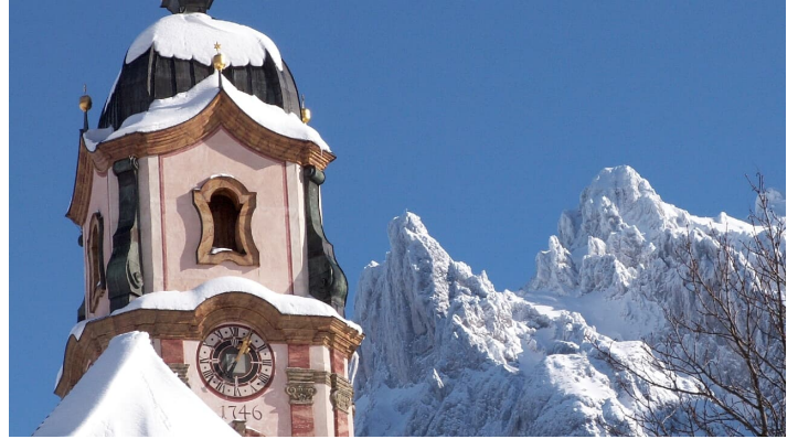
Kirche St. Peter und Paul in Mittenwald Winter - © Alpenwelt Karwendel | Bergschule Alpenwelt Karwendel