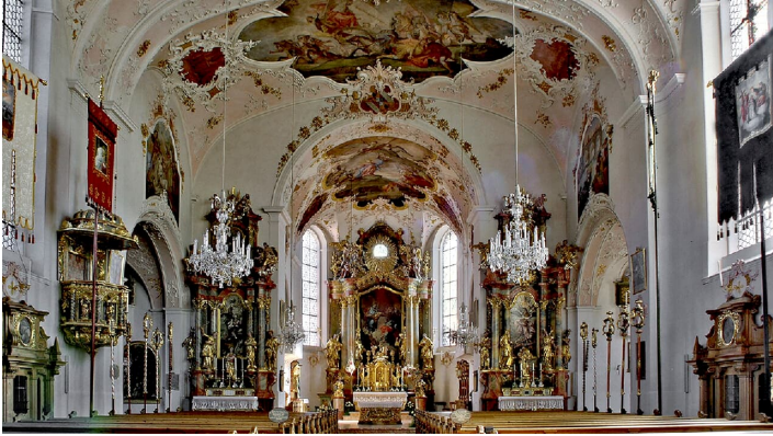
Kirche St. Peter und Paul in Mittenwald mit Freskomalerei