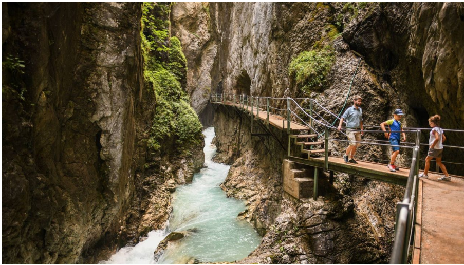
Leutascher Geisterklamm - © Alpenwelt Karwendel | Philipp Gülland, PHILIPP GUELLEND