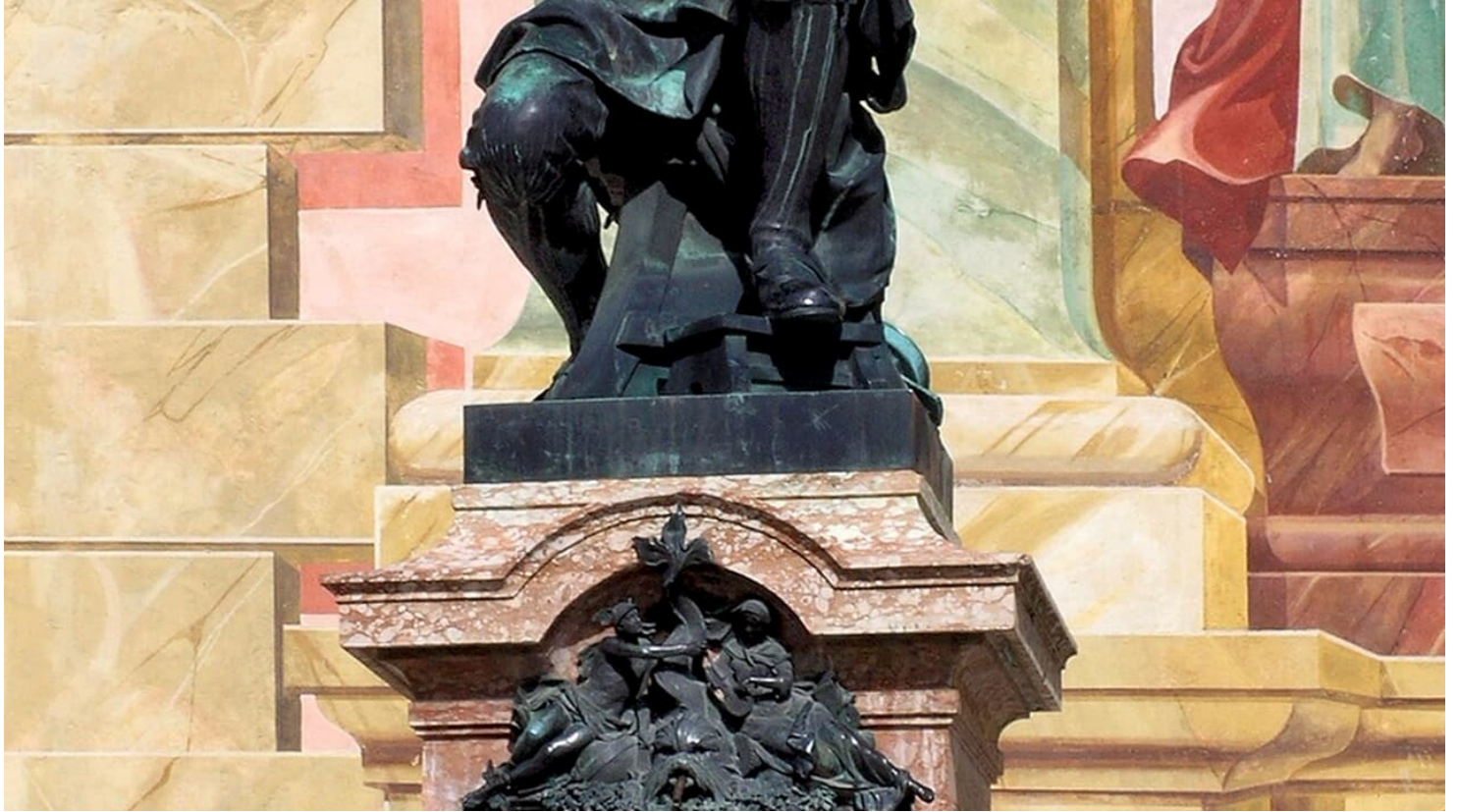
Matthias Klotz-Dankmal in Mittenwald vor der Pfarrkirche St. Peter und Paul