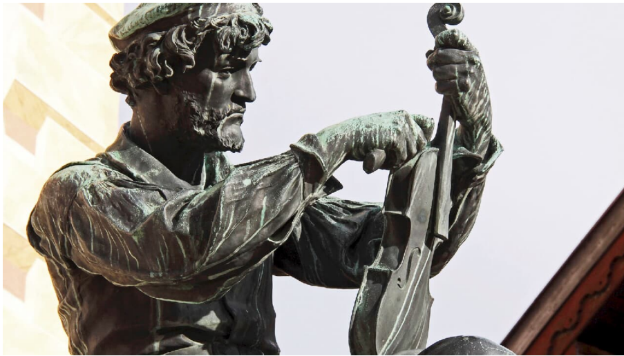
Matthias Klotz-Denkmal in Mittenwald vor der Pfarrkirche St. Peter und Paul