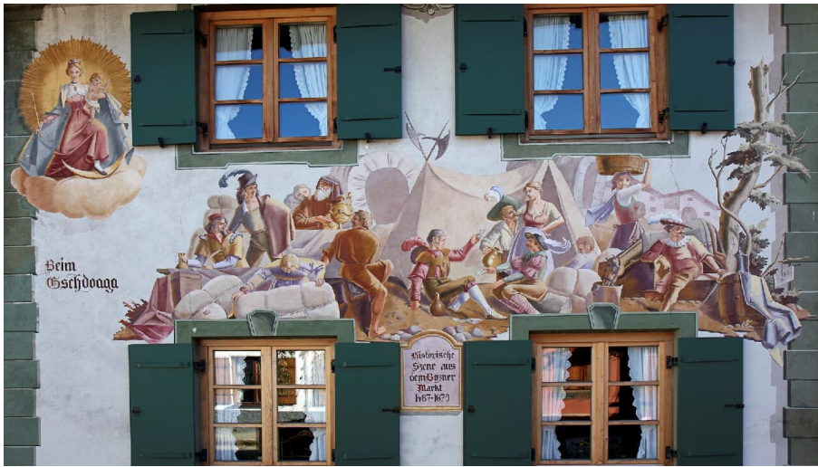
Lüftmalerei Mittenwald