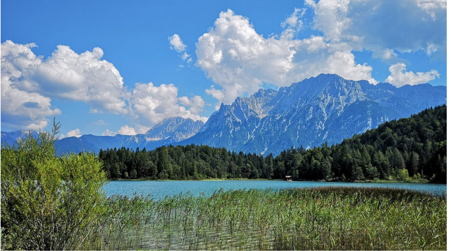
Lautersee im Sommer