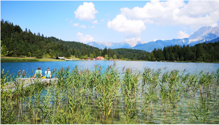
Steg am Lautersee bei Mittenwald in Bayern