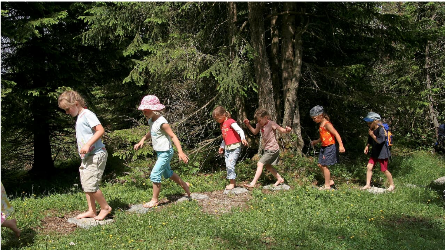
Barfusswanderweg Kranzberg - © Alpenwelt Karwendel | Rudolf Pohmann