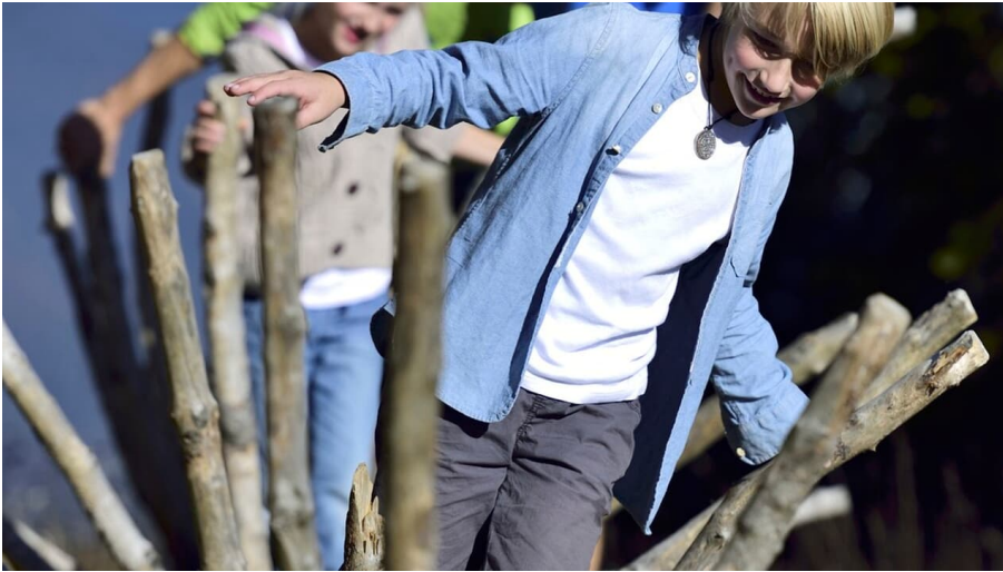
Barfußwanderweg Kranzberg; Station Baumstamm