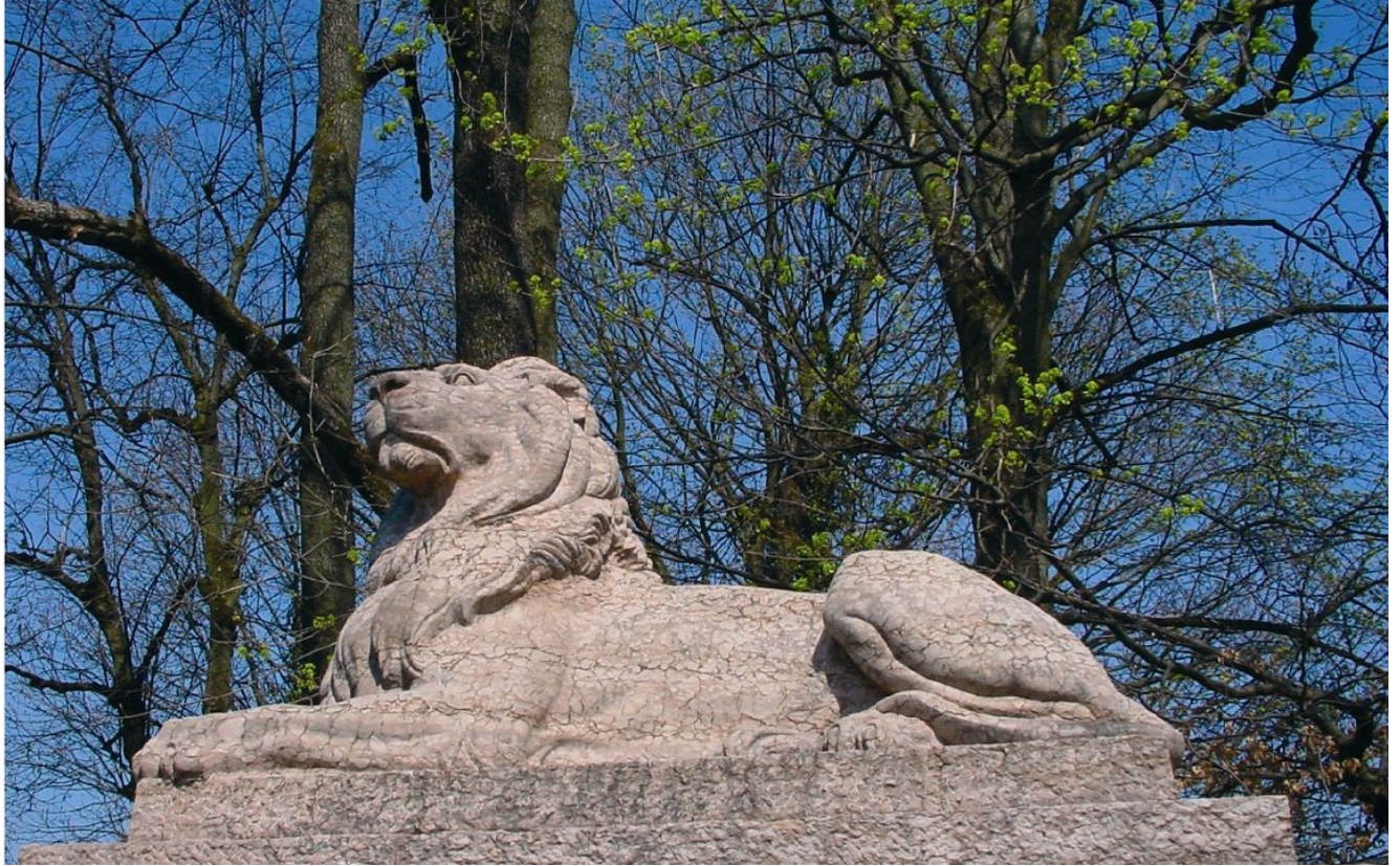
Kriegerdenkmal Irlachstraße Löwe.jpg