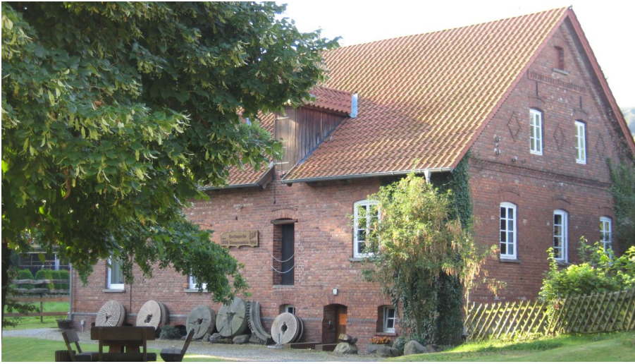
Hartings Mühle Porta Westfalica Kleinenbremen