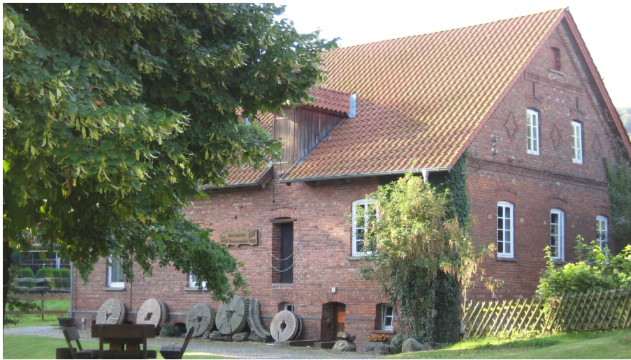
Hartings Mühle Porta Westfalica Kleinenbremen