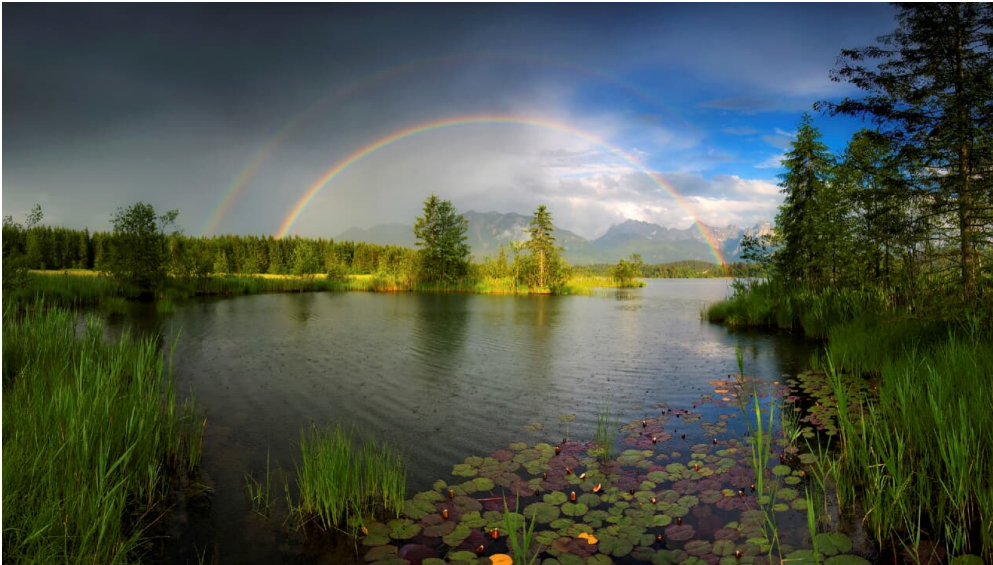
Badeseer Barmsee bei Krün