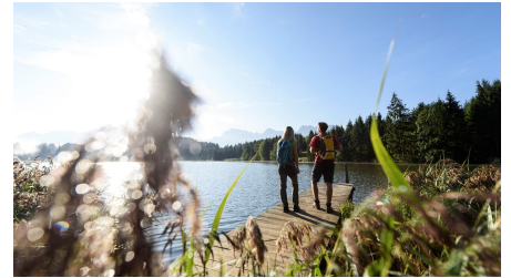
Sommerwanderung Geroldsee