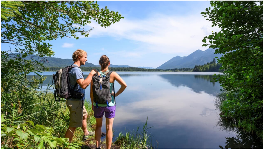
Wanderung am Barmsee bei Krün