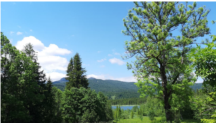
Weg von Barmsee zum Grubsee - © Alpenwelt Karwendel | Andreas Karner