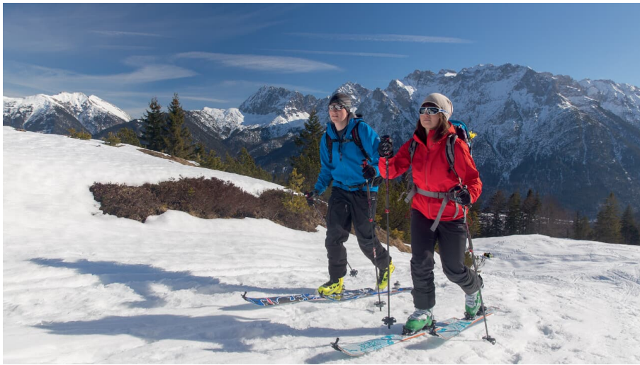
Skitour am Kranzberg