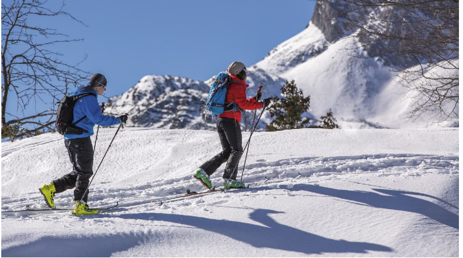
Skitour zum Kranzberg