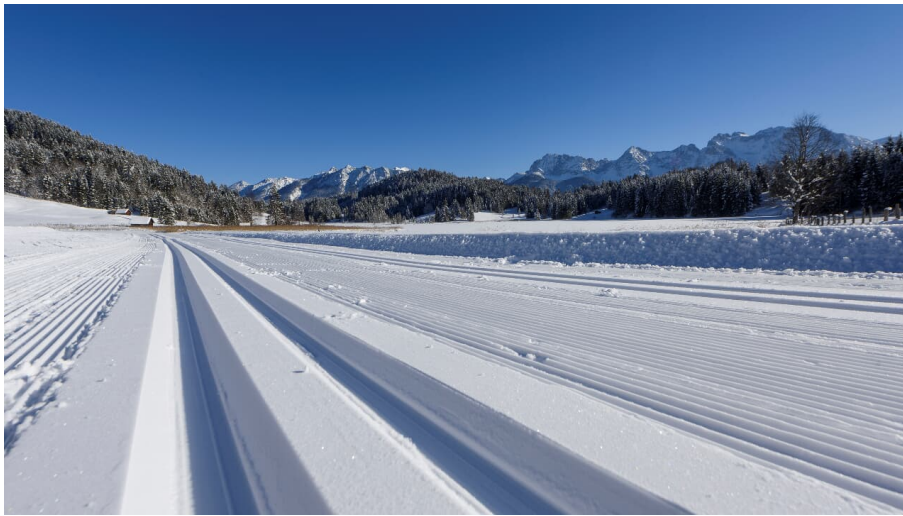
Loipe am Geroldsee