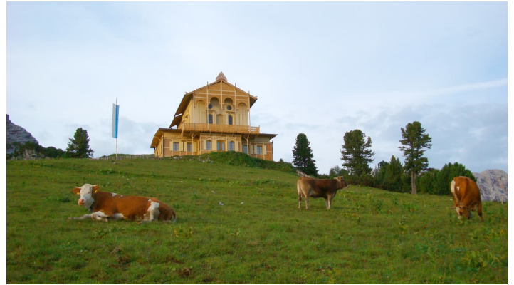
Schachen - © Alpenwelt Karwendel | Christoph Schober