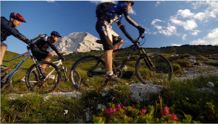
Mountainbiken neben Almrausch