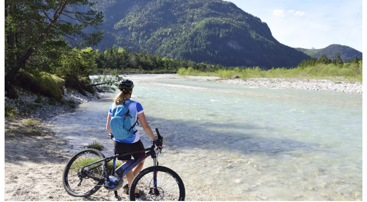
Pause an der Isar