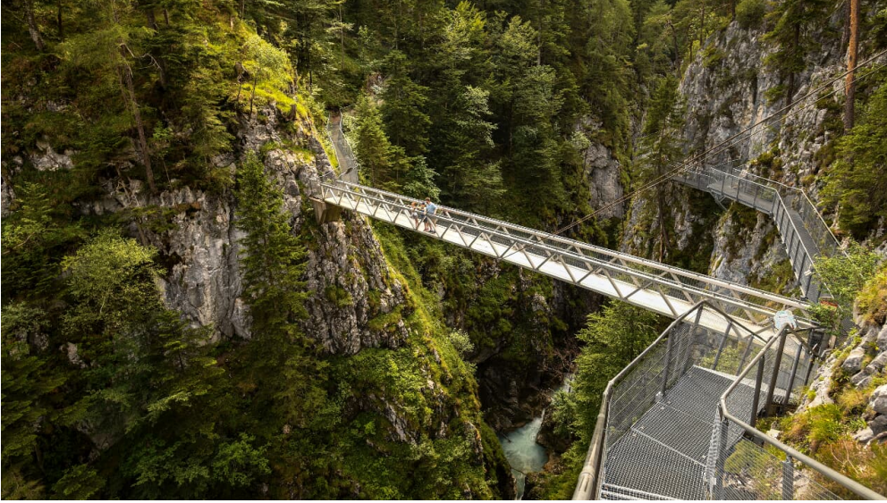
Leutascher Geisterklamm