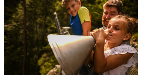
Leutascher Geisterklamm