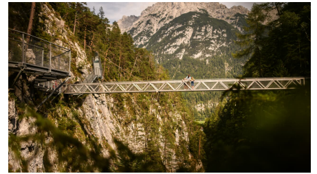
Brücke in der Leutascher Geisterklamm