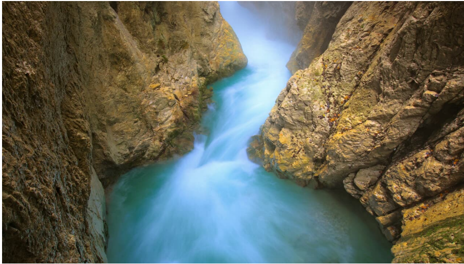
Leutascher Geisterklamm