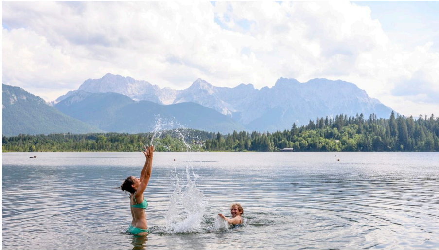
Badespaß am Barmsee