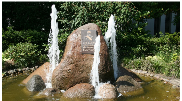
image - © Tourist-Information der Sennegemeinde Hövelhof, Helena Kottowski