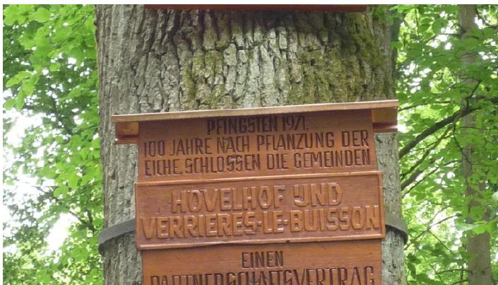
Friedenseiche im Hövelhofer Forst