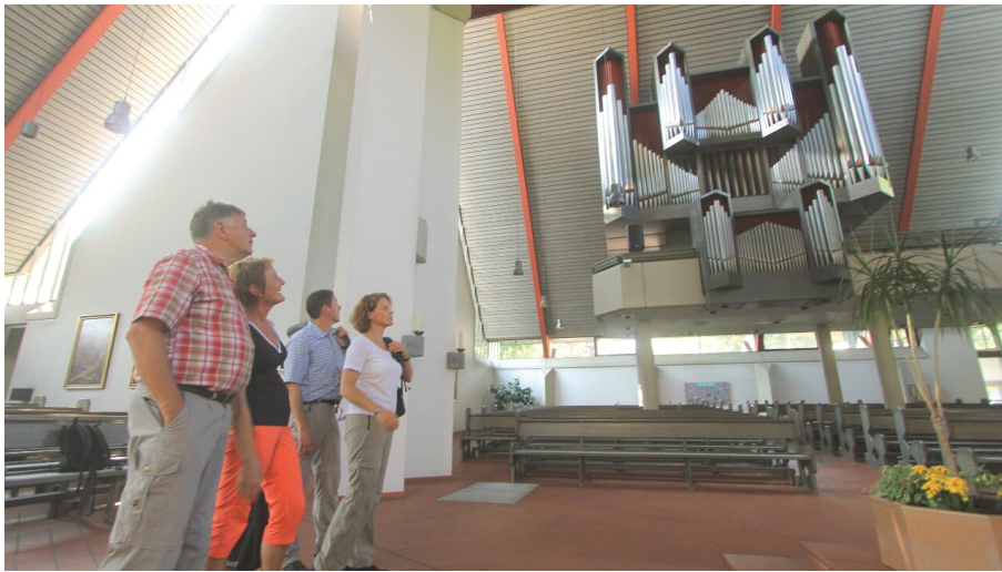
image - © Tourist-Information der Sennegemeinde Hövelhof, Hans Rodenbröker