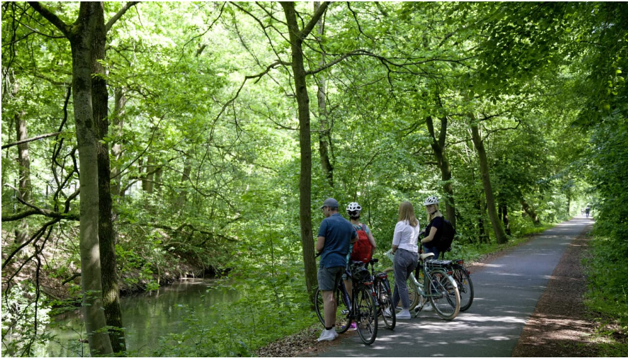
Am Boker Kanal