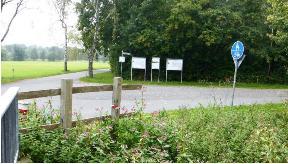
Parkplatz am Boker Kanal