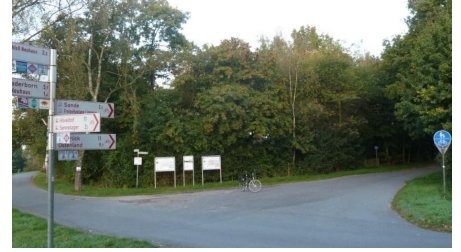
Parkplatz am Boker Kanal Schloß Neuhaus