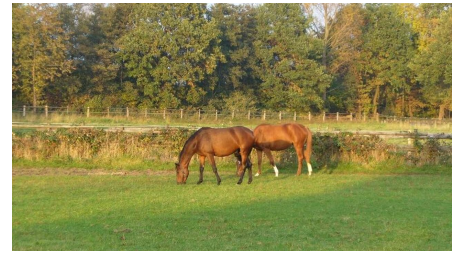
Pferde im Sander Bruch