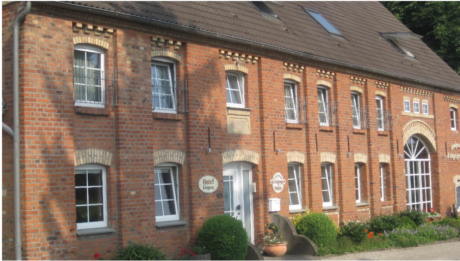
Alt-Enginger Mühle