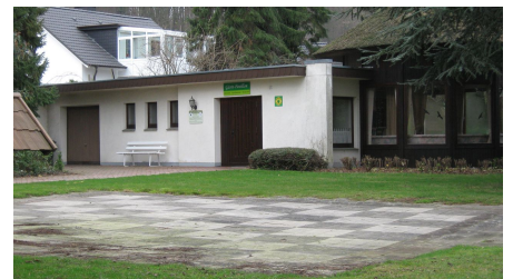
Gästepavillon in der Oldendorfer Schweiz