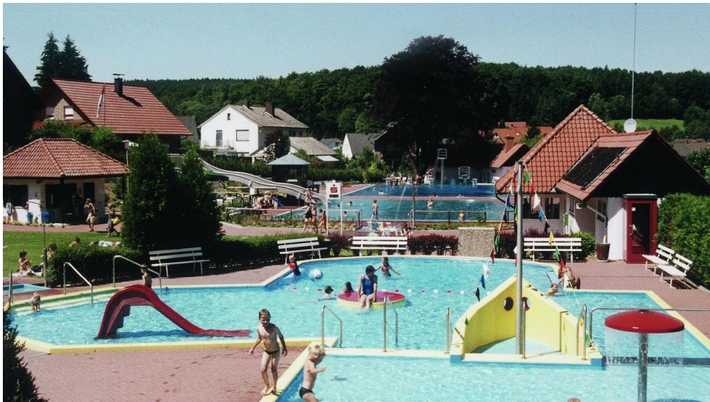
Waldschwimmbad Preußisch Oldendorf