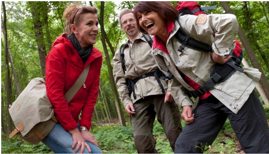
Wandergruppe im Wald