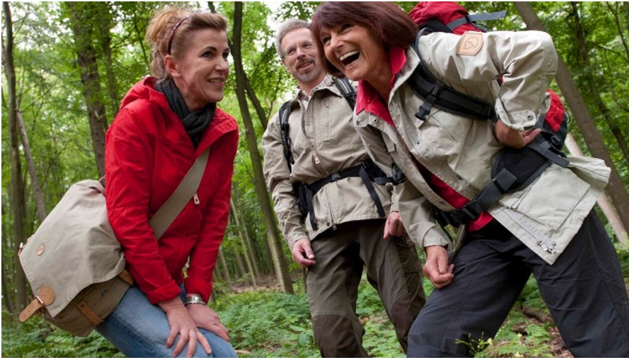
Wandergruppe im Wald