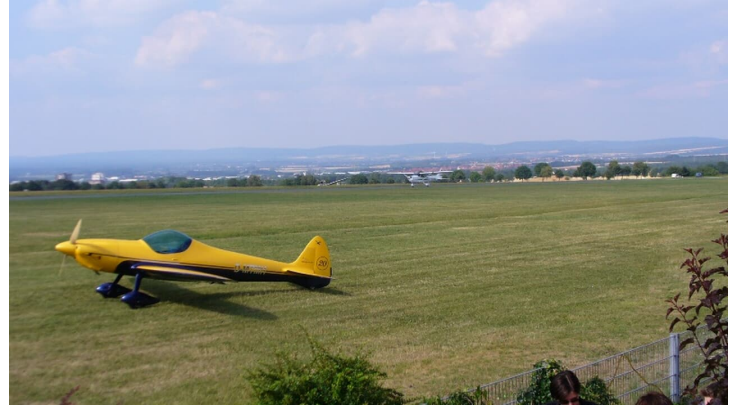
Flugplatz Paderborn-Haxterberg (Landebahn)