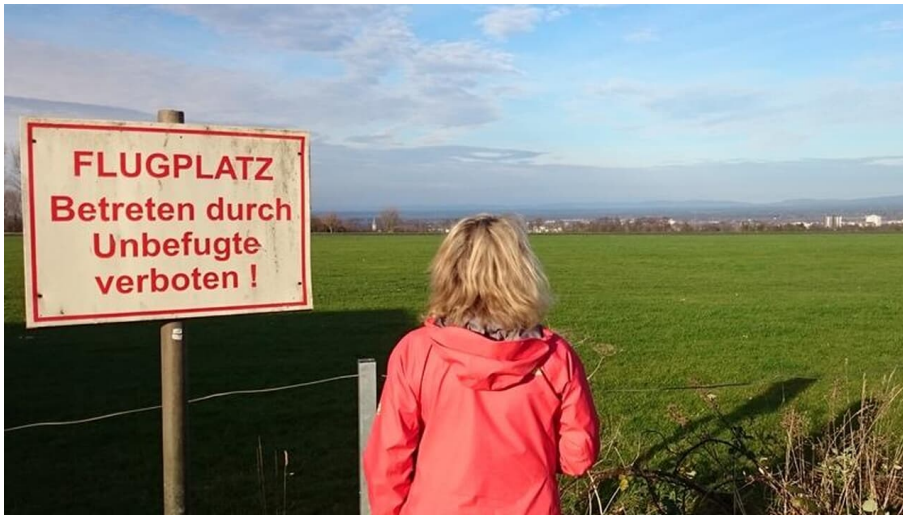
Flugplatz Paderborn-Haxterberg (Flugfeld)