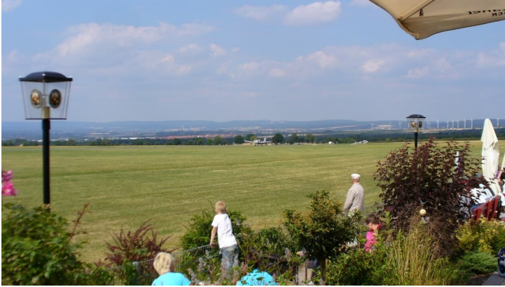
Flugplatz Paderborn-Haxterberg (Terrasse)