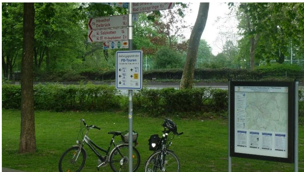
Startort der Paderborn-Touren am Mäspenplatz - © Karl Heinz Schäfer, Tourist Information Paderborn / Verkehrsverein Paderborn e.V.