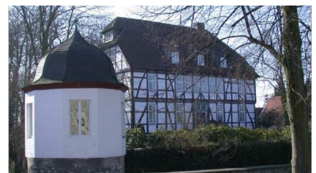
Mallinckrothof mit Annettentempelchen