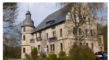
Schloss Hamborn bei Borcheln