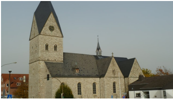
Pfarrkirche St. Johannes Baptist