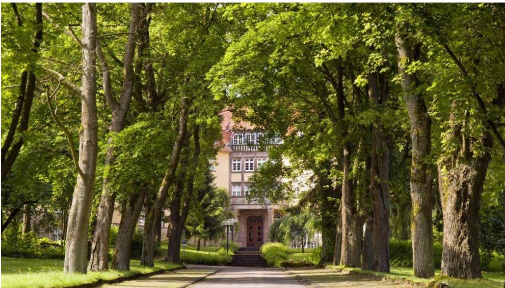
Clemensheim Bad Driburg