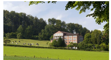
St. Clemens Bad Driburg