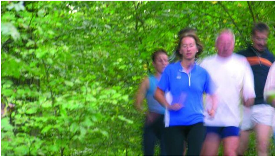
Laufgruppe auf dem Gesundheits- und Fitness-Parcours Bad Driburg