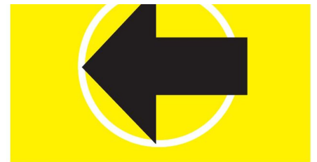
Tour Gesundheits- und Fitness-Parcours Bad Driburg