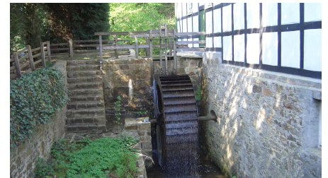
Gutswassermühle Hudenbeck