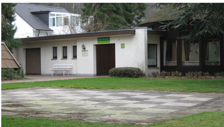
Gästepavillon in der Oldendorfer Schweiz