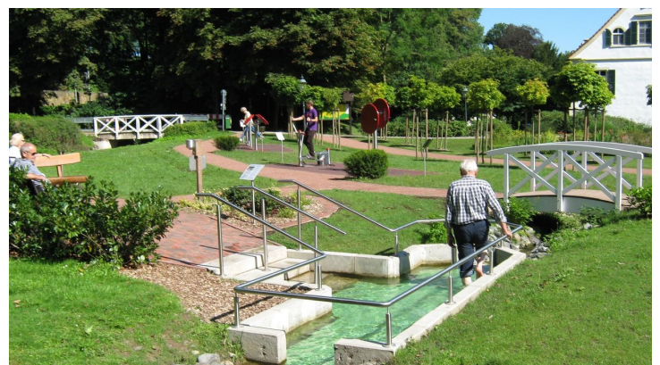
Wassertretbecken im Kurpark Bad Holzhausen