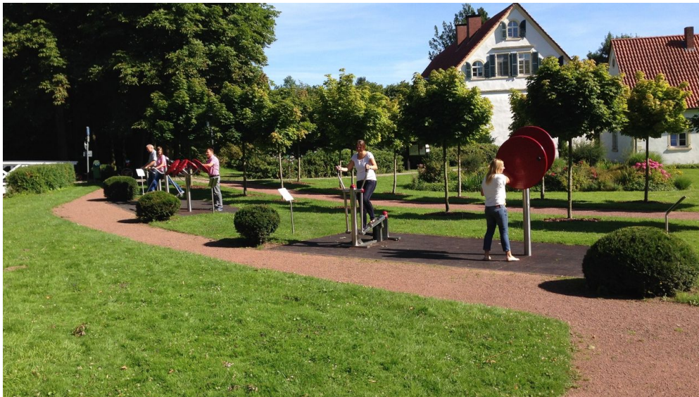
Garten der Generationen