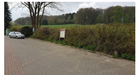
Wanderparkplatz Oldendorfer Schweiz