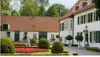
Haus des Gastes im Sommer