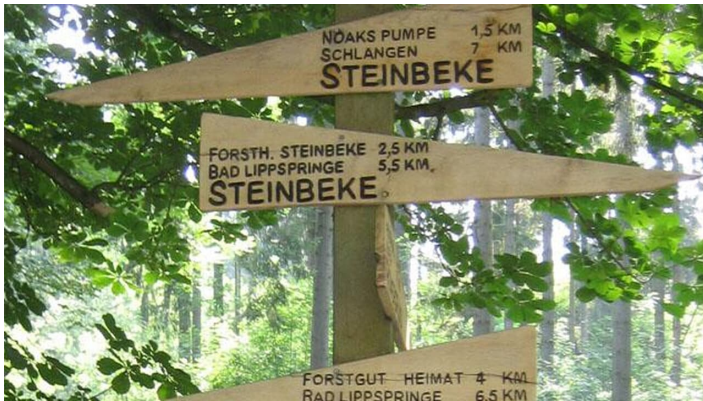
Römerbrunnen (Steinbeke) Lippspringer Wald