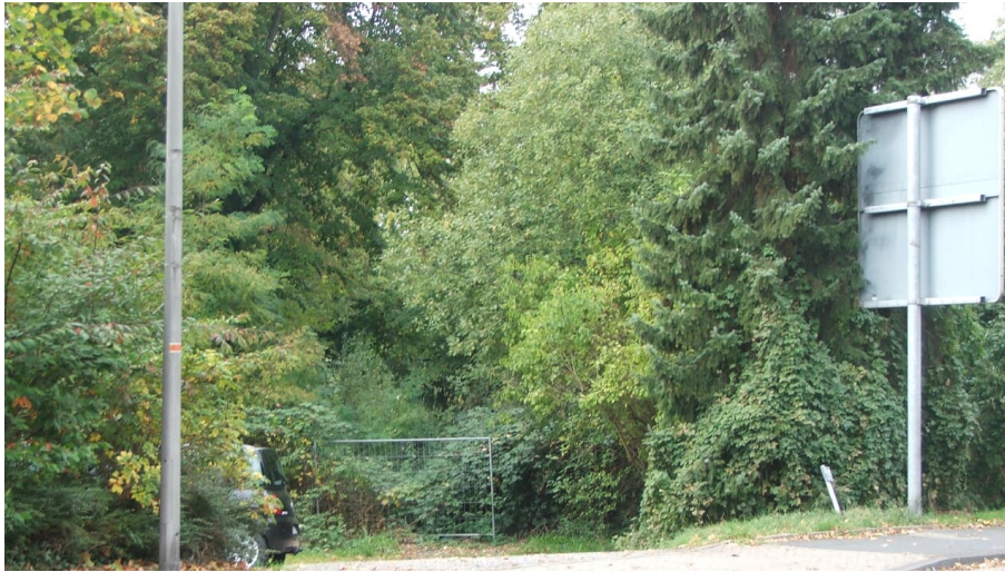
Gelände Alte Burg