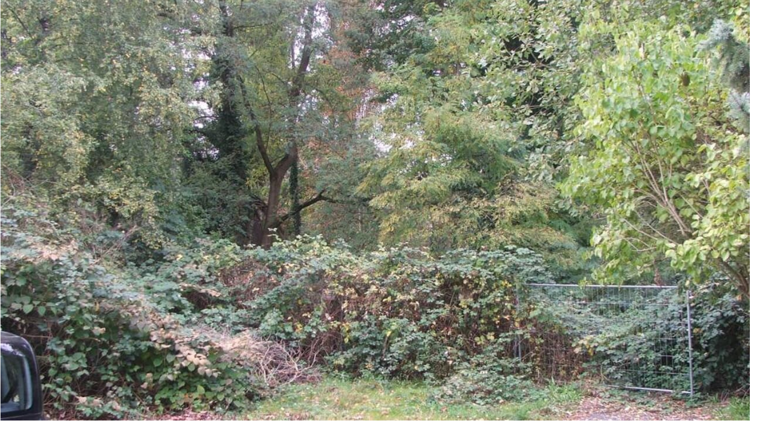
Gelände Alte Burg