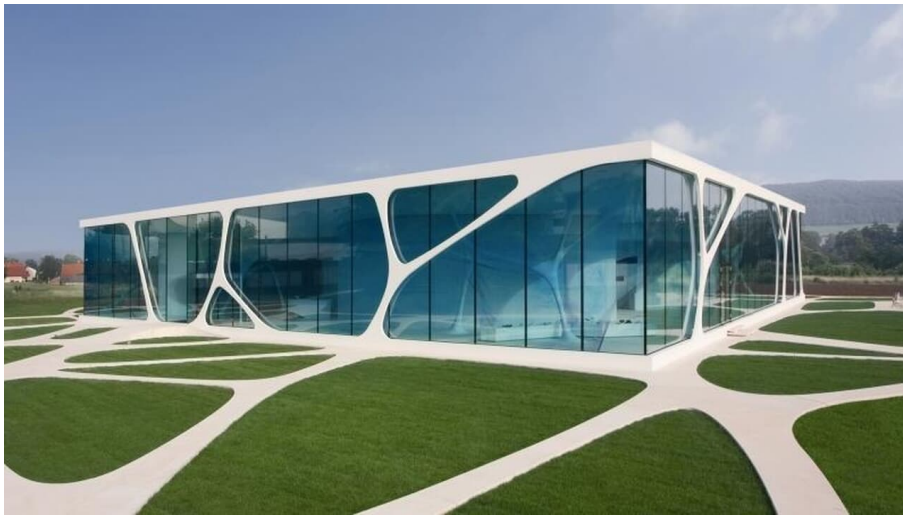
LEONARDO glascube im Bad Driburger Ortsteil Herste