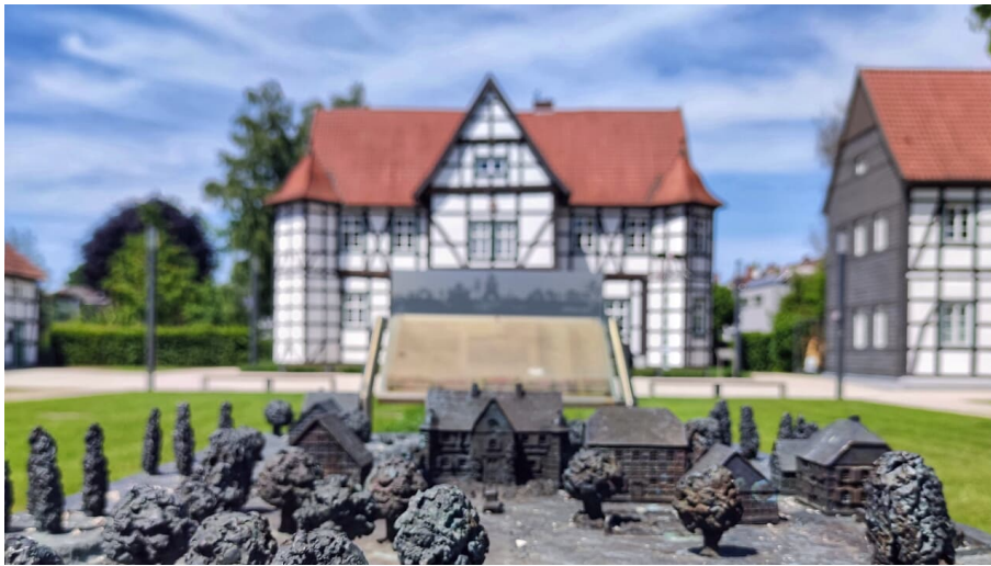
Geländemodell Schlossgarten