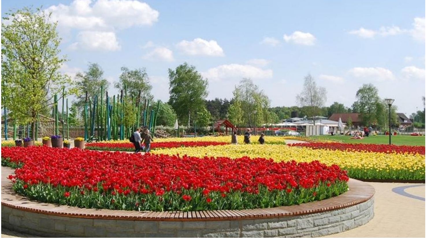
Gartenschaupark Rietberg Eingangsbereich Mitte/Historischer Stadtkern