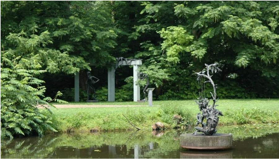
Klostergarten Rietberg - Skulpturenpark Wilfried Koch