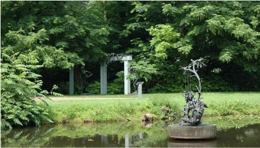
Klostergarten Rietberg - Skulpturenpark Wilfried Koch