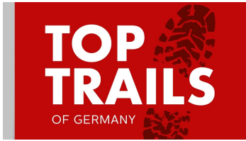
Logo der Top Trails of Germany