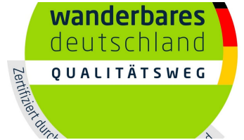
Logo Qualitätsweg Wanderbares Deutschland - © Ina Bohlken, Projektbüro Hermannshöhen