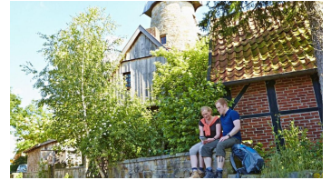
Levedags Mühle: Rast