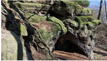
Hexenküche in Tecklenburg - © Ina Bohlken, Projektbüro Hermannshöhen