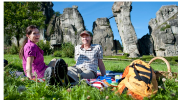
Wanderrast an den Externsteinen