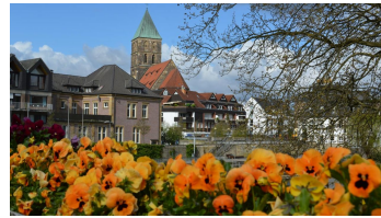
Blick auf die Innenstadt