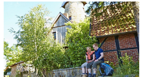
Levedags Mühle: Rast