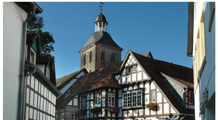
Tecklenburg - Deutschlands nördlichstes Bergstädtchen - © Michael Münch, Projektbüro Hermannshöhen