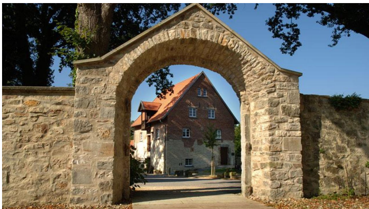
Hörstel - Kloster Gravenhorst