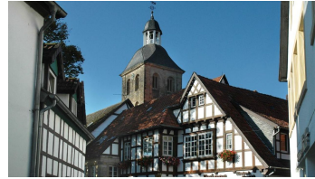
Tecklenburg - Deutschlands nördlichstes Bergstädtchen