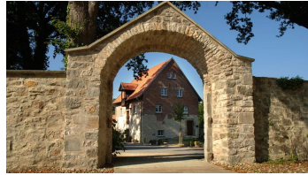
Hörstel - Kloster Gravenhorst - © Michael Münch