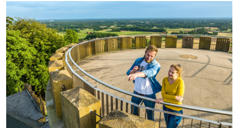
Borgholzhausen-Burg Ravensberg-Teutoburger-Wald-Tourismus-D-Ketz-091.jpg