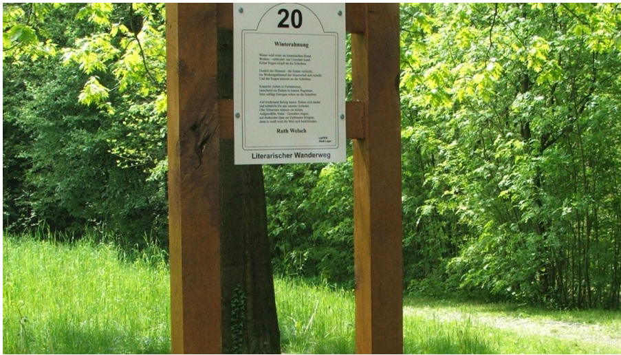
Literarischer Wanderweg