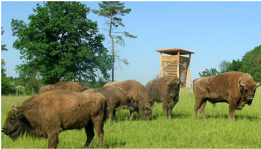
Wisentgehege am Waldinformationszentrum Hammerhof