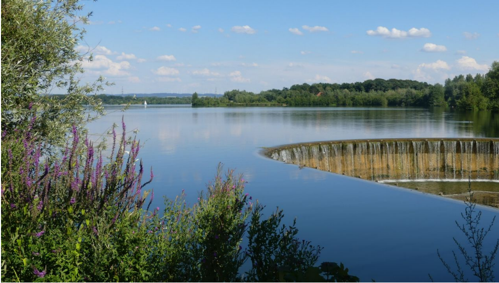
Blick über den Lippesee vom Auslaufbauwerk