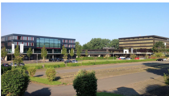
Heinz Nixdorf MuseumsForum (re.) und Zukunftsmeile