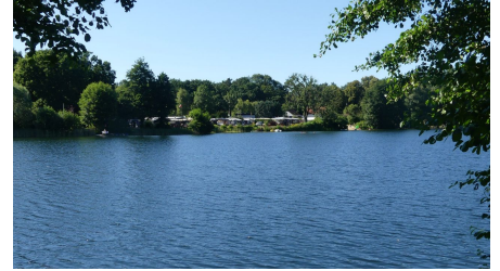
Waldsee - im Hintergrund der Campingplatz