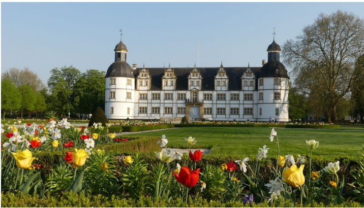
Schloß Neuhaus mit Barockgarten (Frühlingsbepflanzung)