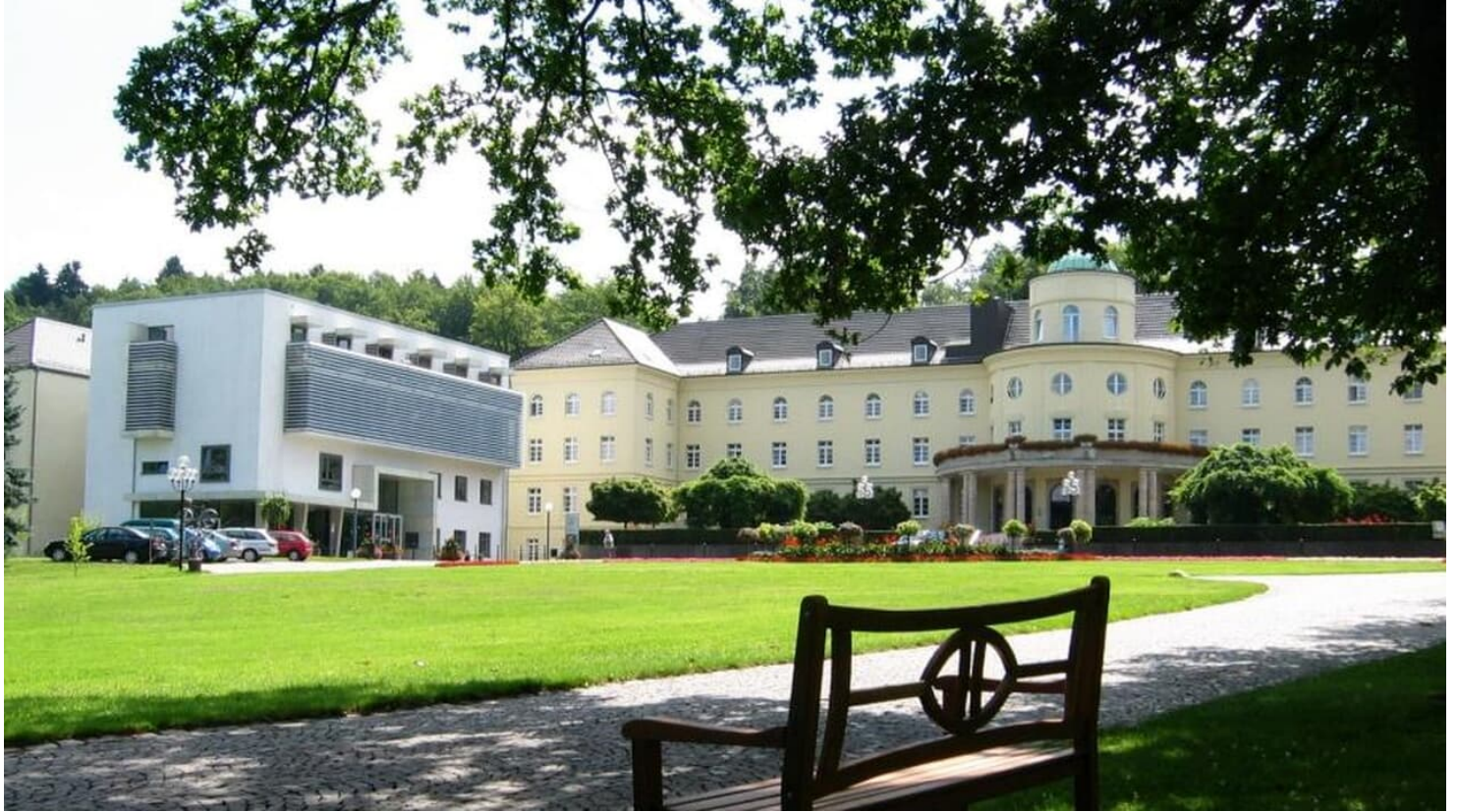
Park Bad Hermannsborn - Bad Driburger Ortsteil