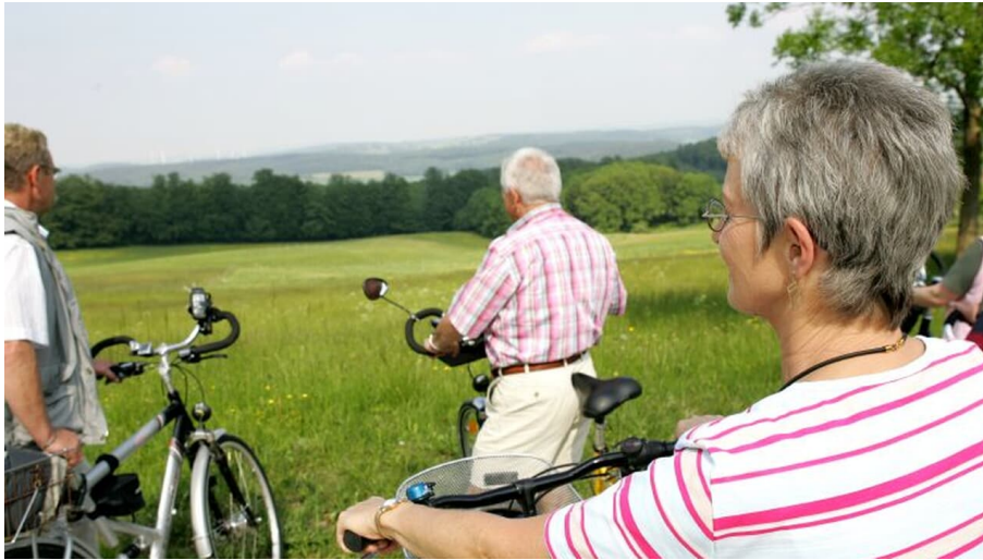
Bad Driburger Radroute, Tour 1