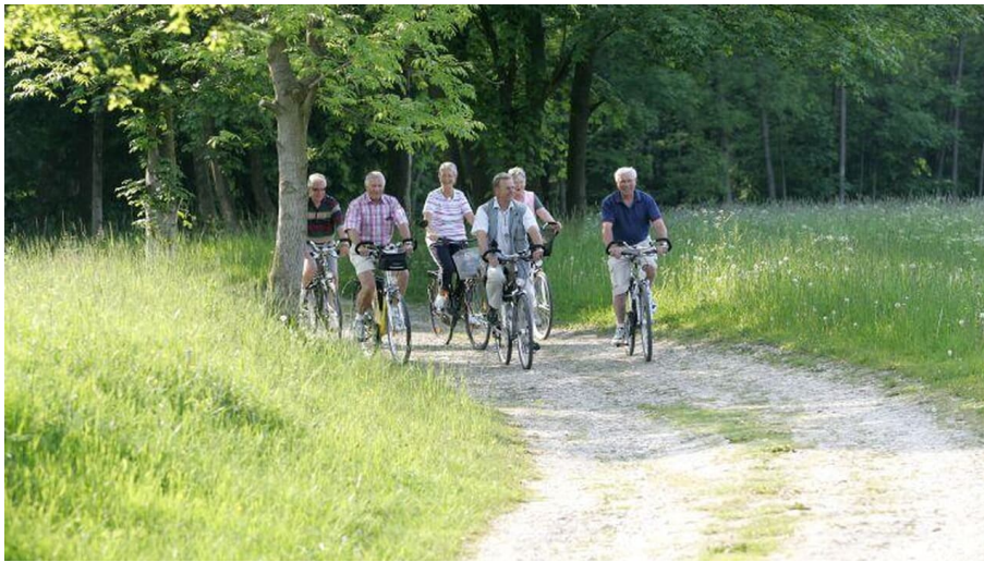
Bad Driburger Radroute, Tour 3