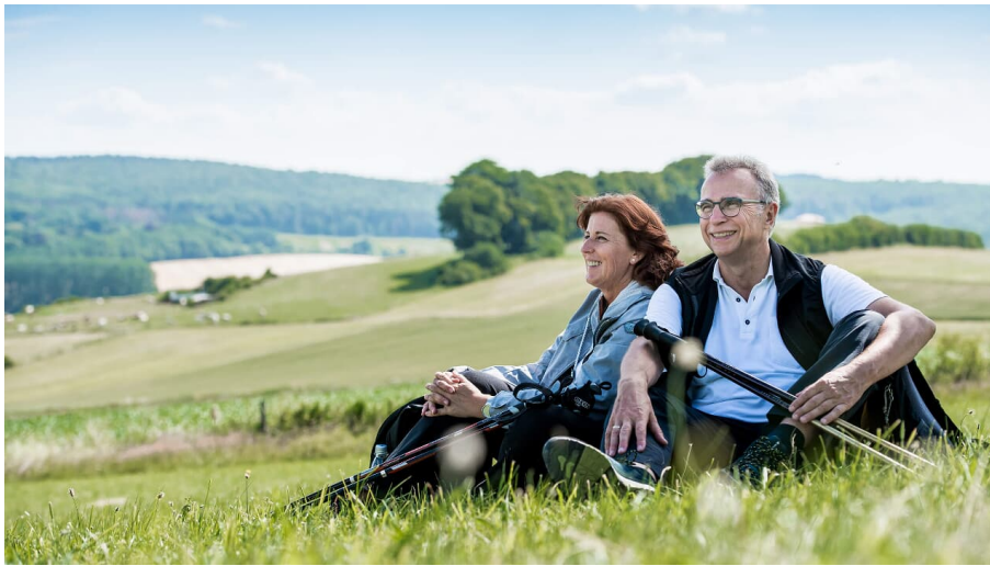
Kurze Rast auf dem Gesundheits- & Fitnessparcours