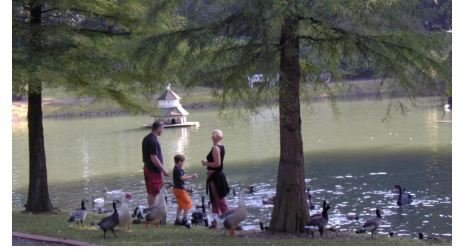
Kurpark - © Touristik-Preußisch Oldendorf