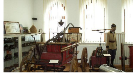
Feuerwehrmuseum Schröttinghausen