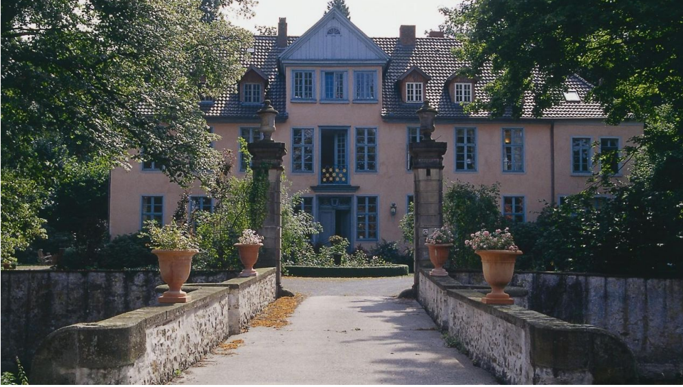
Gutshof Engershausen