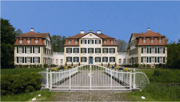
Schloss Hüffe