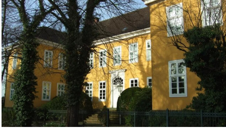
Haus Münte