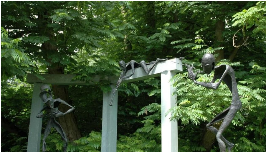
Klostergarten Rietberg - Skulpturenpark Wilfried Koch