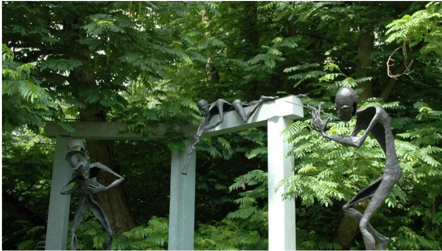
Klostergarten Rietberg - Skulpturenpark Wilfried Koch - © Stadt Rietberg, Stadt Rietberg