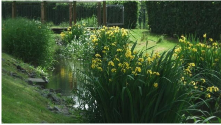
Am Westwall