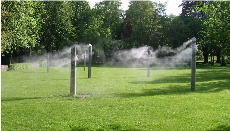
Nebelwiese Bad Lippspringe