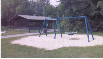
Familien-Freizeitplatz Bad Lippspringe