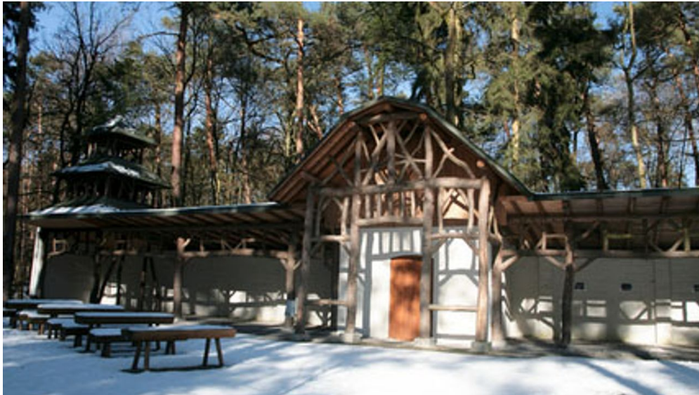
Liegehalle Bad Lippspringe