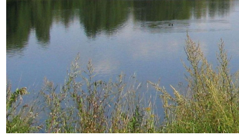
Strothesse Bad Lippspringe