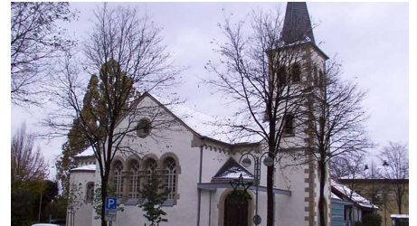
Evangelische Kirche Bad Lippspringe