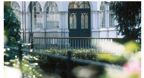
Liborius-Trinkhalle Bad Lippspringe