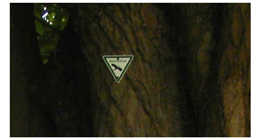
Hermann Löns-Eiche Bad Lippspringe