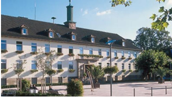
Rathaus Bad Lippspringe