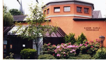
Kaiser-Karls-Trinkhalle Bad Lippspringe - © Thomas Fischer, Tourist-Information Bad Lippspringe