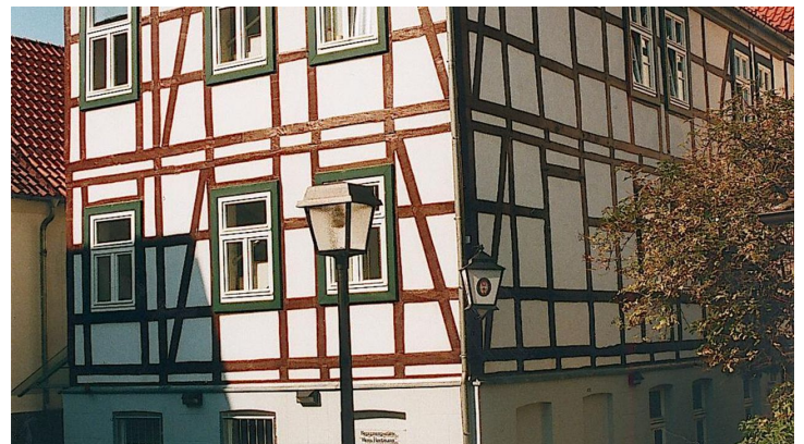
Heimatmuseum Bad Lippspringe