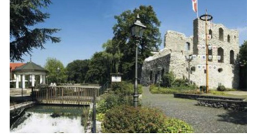
Burgruine Bad Lippspringe