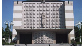
Kath. St. Marien Kirche Bad Lippspringe