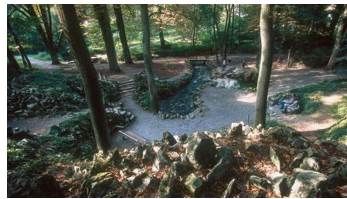
Jordanelle Bad Lippspringe