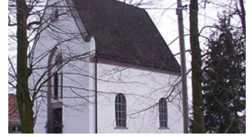
Lindenskapelle Bad Lippspringe - © Thomas Fischer, Tourist-Information Bad Lippspringe