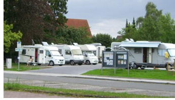
Wohnmobil-Stellplatz Bad Lippspringe