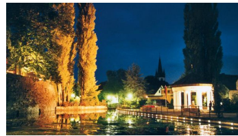
Lippequelle Bad Lippspringe