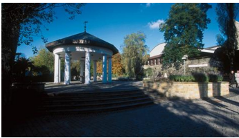
Arminius Brunnentempel Bad Lippspringe