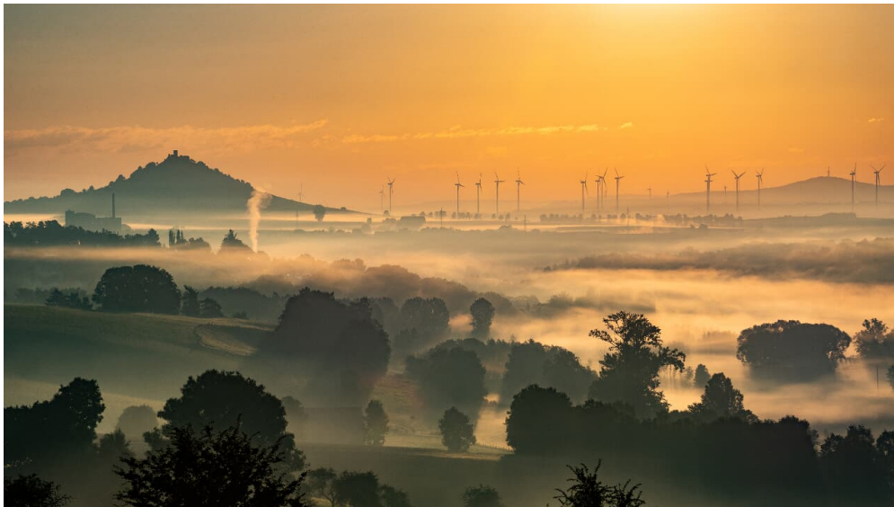
Landschaft am Desenberg