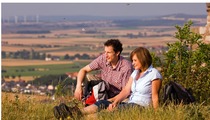
Desenberg - © F. Grawe, Kulturland Kreis Höxter