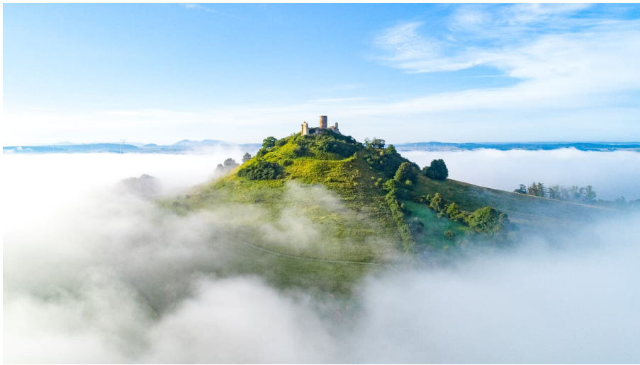
Desenberg im Nebel